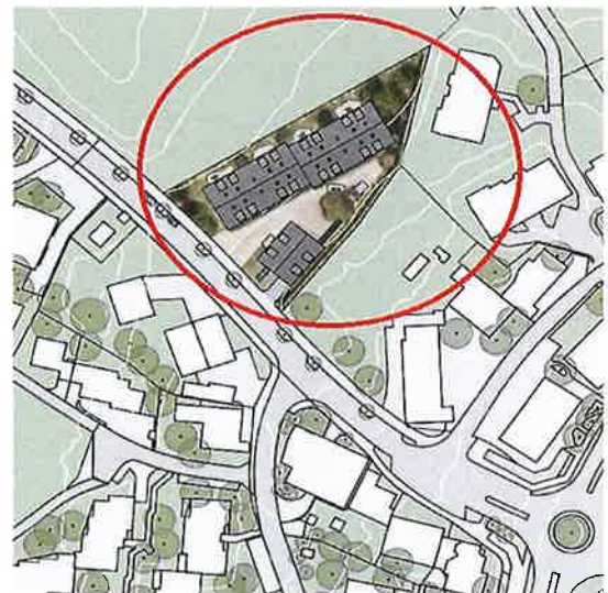
Gestaltungsplanperimeter Grundstück Kat.-Nr. 5990, Chappelistrasse