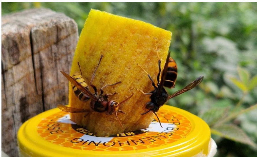
Abbildung 1: Zum Vergleich: Europäische Hornisse links und Asiatische Hornisse rechts im Bild.

Die Asiatische Hornisse bedroht die einheimische Insektenwelt stark, insbesondere Honig- und Wildbienen, was gravierende Auswirkungen auf Biodiversität, Ökosysteme und Landwirtschaft haben kann. Bei hoher Populationsdichte kommt es zudem zu Schäden an Obst- und Rebkulturen. Durch die aggressive Nestverteidigung steigt auch das Risiko für Menschen, besonders für Personen in Garten-, Land- und Forstwirtschaft sowie für Allergiker. Während Gründungsnerster (Primärnerster) im Frühling oft in Siedlungsnähe entstehen, bauen die Hornissen im Sommer grosse Sekundärnerster in hohen Baumkronen, die mehrere Tausend Tiere beherbergen können.