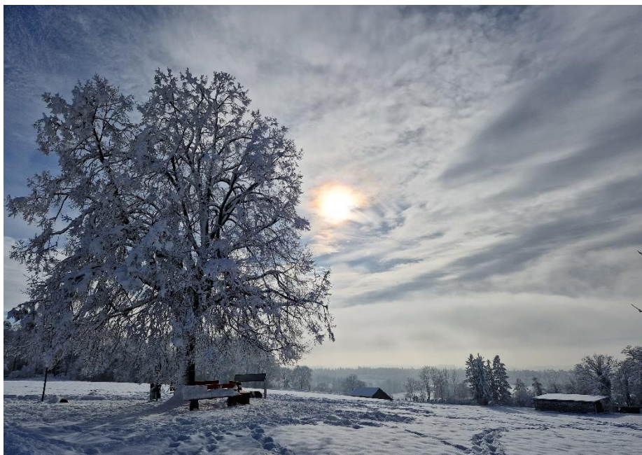
Abbildung 2: Kurz aber schön, Wintereinbruch, Egg bei Gutenswil 2023.

Zum jetzigen Zeitpunkt ist noch nicht klar ob und in welcher Form es wieder das Angebot eines Holzerkurses geben soll. Gerne möchte ich das Echo abwarten um entsprechende Vorbereitungen treffen zu können. Interessierte Personen können sich mit entsprechender Angabe ob Basis- oder Weiterführungskurs-Holzernte bis zum 31. Januar 2024 bei mir melden.