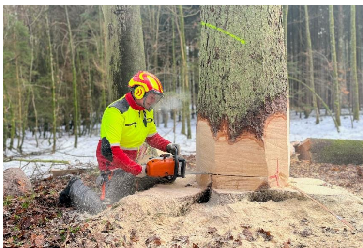
Abbildung 1: Schön geschroteter Stamm am Holzerkurs 2023.

Zwischen dem 04. und 08. Dezember fanden wieder zwei Holzerkurse für Waldbesitzerinnen, Waldbesitzer und weiteren interessierten Personen statt. Fünf Personen besuchten den Basis-kurs-Holzernte und 10 Personen den Weiterführungskurs-Holzernte. Alle Teilnehmerinnen und Teilnehmer schlossen erfolgreich ab!